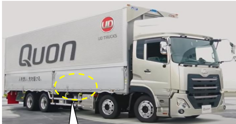
駐車ブレーキ用エアプレッシャーセンサ