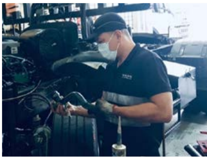
▲シンガポールの現場スタッフは、活動自粛を最小限に抑えつつ、最大限の稼働を実現。