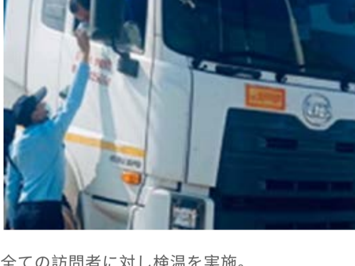
▲タイにおける安全確保のための取り組み事例の紹介。全ての訪問者に対し検温を実施。