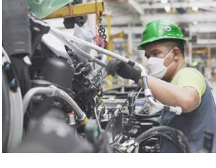
▲上尾の本社工場では、消毒・殺菌作業の徹底と防疫対策を講じた上で稼働させています。