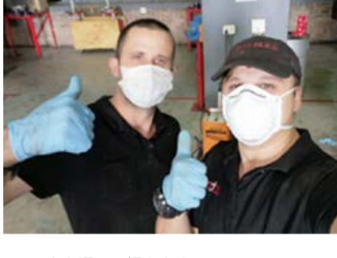
▲南アフリカのディーラー従業員による笑顔がフェイスマスクを通して輝きます。