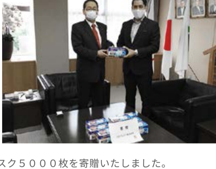
▲UDの従業員を守る上に、上尾市内の保育施設にマスク5000枚を寄贈いたしました。