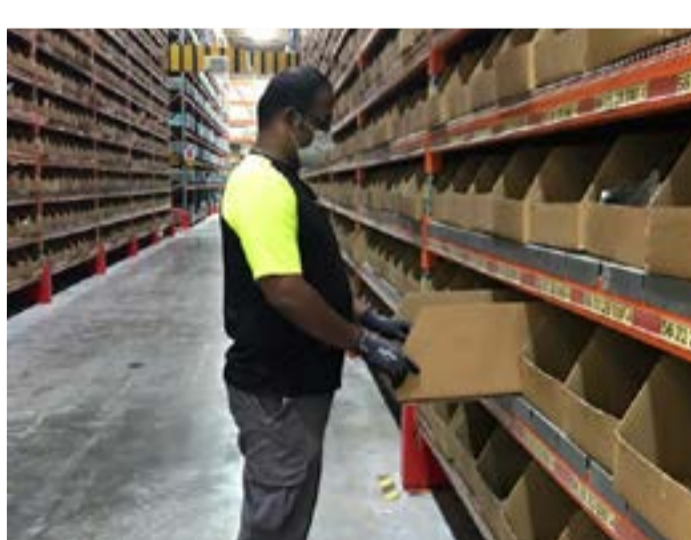
▲コロナ危機により世界中で重要性が高まるパーツの確保——ドバイのパーツ供給センターでは防疫対策を講じた上で稼働を継続。